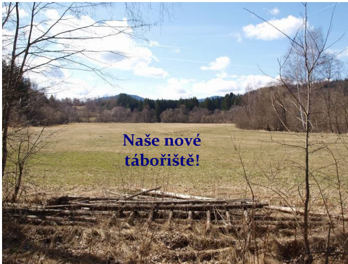
Naše nové tábořiště!